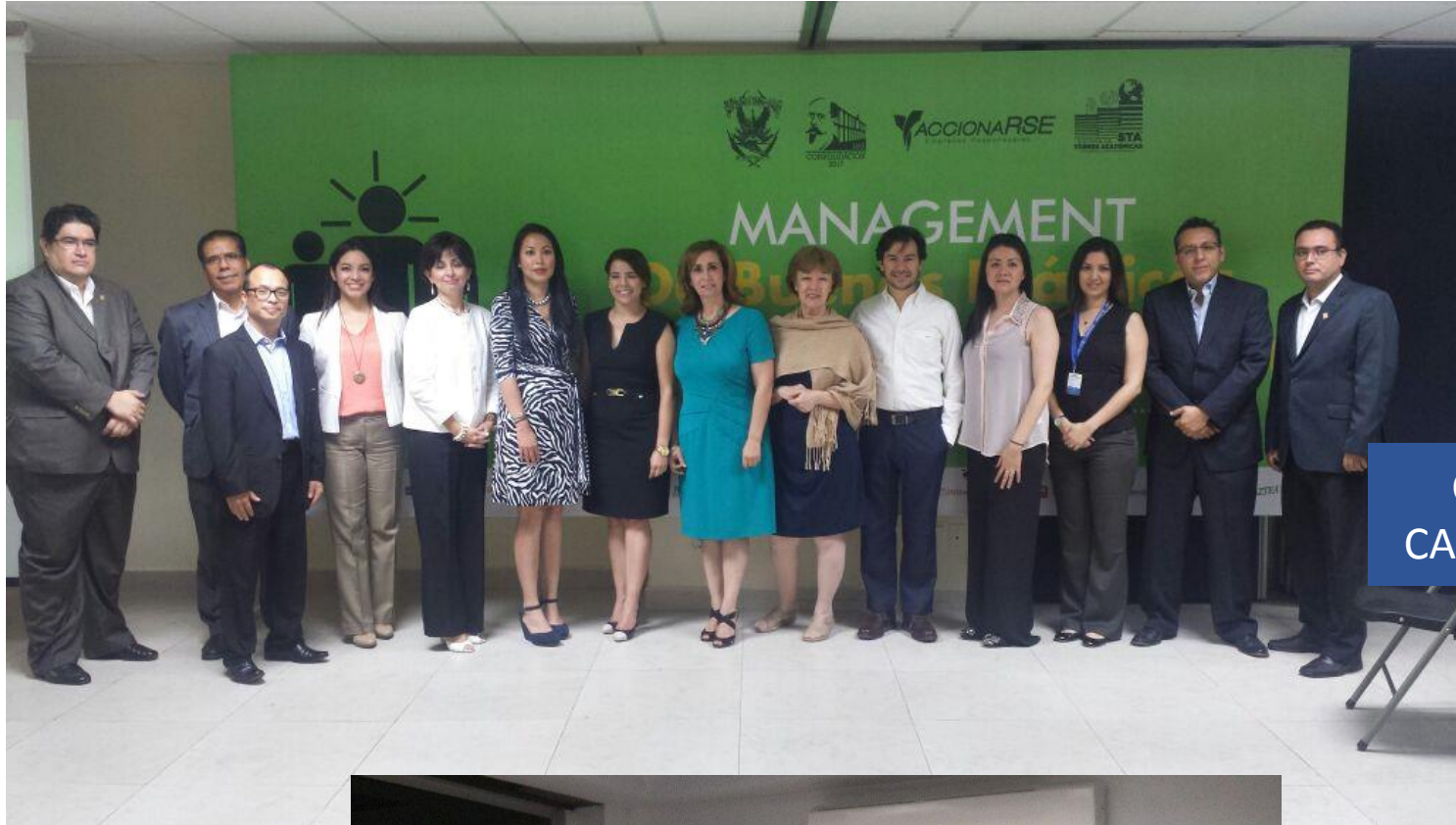
Constitución y formalización del CADISE, el 5 de septiembre de 2014.