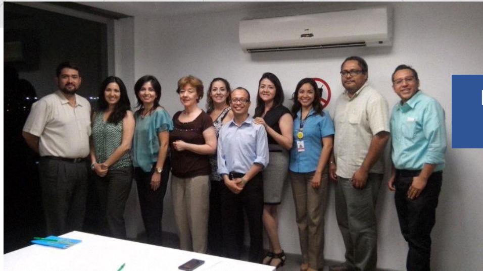
Primera reunión del grupo el 10 de junio de 2014.